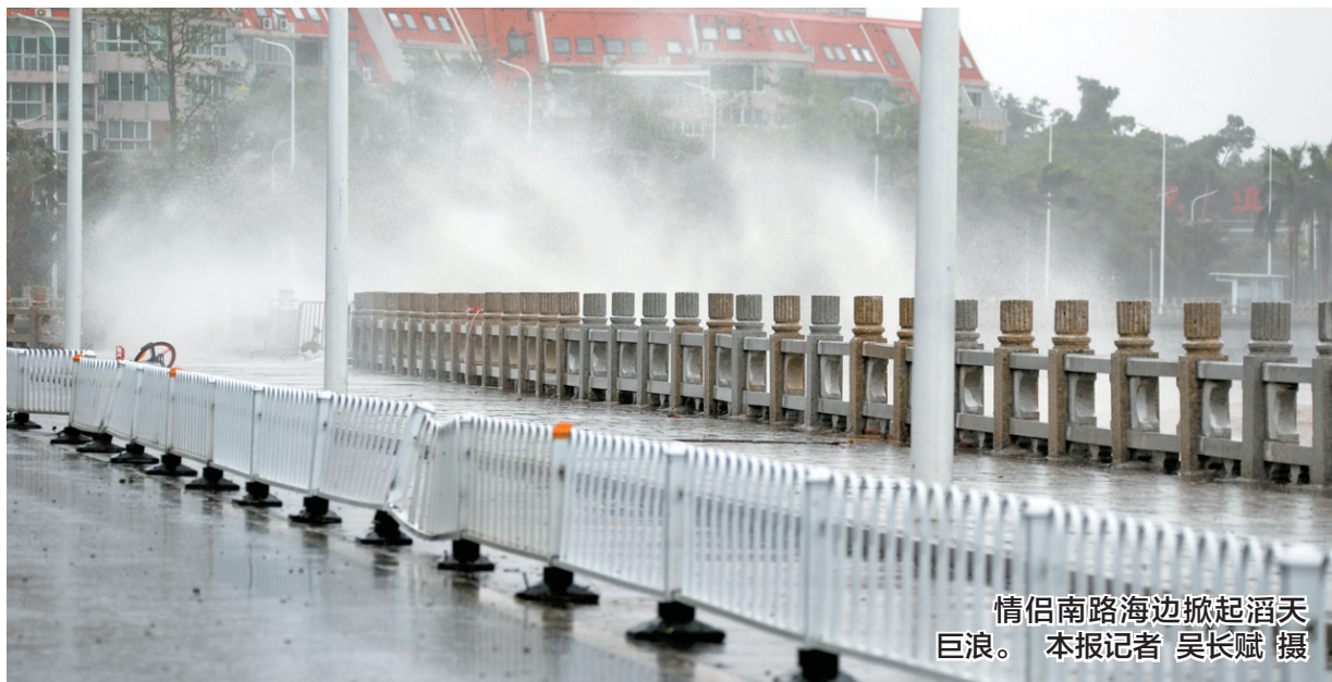
情侣南路海边掀起滔天巨浪。

面对防御工作“大考”,全市上下在市委市政府科学领导下,早部署,充分准备,成功抵御台风影响,截至16日晚记者发稿时,全市无人员死亡。