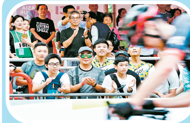
前往现场,近距离观赏国际级选手的精彩表现。

随着“旅游+”时代的到来,消费者的行为模式正在经历蜕变,香港旅游发展局将为其打造契合需求的盛事活动。香港旅游发展局有关人士表示,香港自行车节将运动、亲子等理念完美融合,不仅拥有赛事激烈的专业级选手竞技,同时为业余爱好者和普通大众提供了多种类别的娱乐活动,为到港游客提供了更多选择,亲身享受运动带来的乐趣。