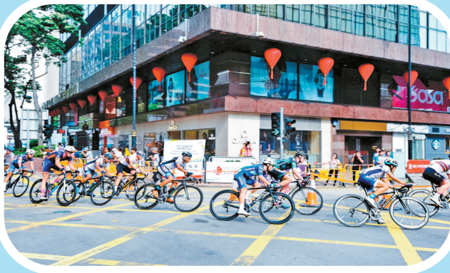
结队为伴,在运动中畅享香港城市风光。

除国际级顶尖赛事外,香港自行车节近年继续开设“50公里组”及“30公里组”自行车活动,自行车运动爱好者可亲身参与,享受驰骋于公路的乐趣,饱览沿途迷人的香港城市风貌及著名的天际线。