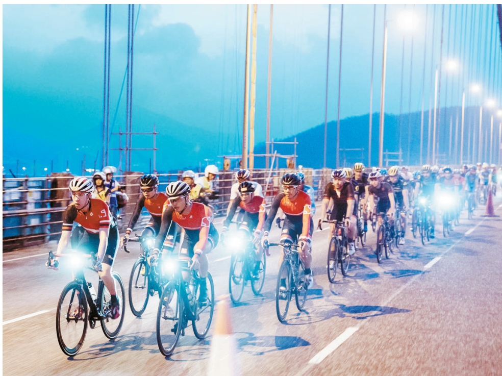
业余单车爱好者们亦可参与挑战,亲享运动激情。

城市太拥挤,独行太寂寞,你需要一场浩浩荡荡的香港自行车节,体验运动带来的激情和愉悦。今年,由香港旅游发展局主办的第四届“新鸿基地产香港自行车节”将于10月14日拉开序幕。比赛设有3项专业赛事、5个自行车活动,不仅有国际顶级专业车手的热血酣战,还为骑行爱好者们提供了尽享自行车运动乐趣的绝佳机会。值得瞩目的是,国际顶级专业自行车赛事——锤子系列赛首度登临亚洲,系列赛香港站作为今年该系列赛的最后一站,即将迎来国际顶级车队上演激烈角逐。金秋十月,前往香港,体验骑行精彩吧。