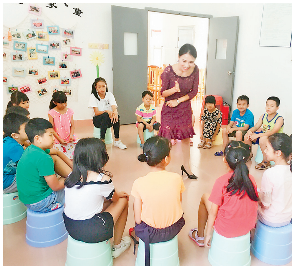
小濠涌村举行文明礼仪公益课,孩子们诵读弟子规。

据小濠涌妇女儿童之家负责人介绍,文明礼仪的形成需要时间,所以为孩子们设计了12期礼仪课。希望这些公益课程为孩子们从小种下文明礼仪的种子,在心中生根发芽,帮助孩子形成正确的世界观、人生观和价值观。