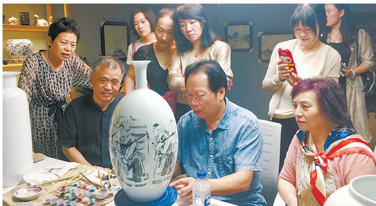
现场切磋技艺。

幅高5.52米、宽3.63米的瓷板画《将相和》,作品刚刚完工他便来到珠海与我市美术界人士沟通交流,互相切磋技艺。