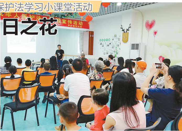
8月29日,平沙镇司法所联合平沙镇妇联开展未成年人保护法学习小课堂活动。

知识,为民之家驻点社工在讲座期间穿插开展法律知识有奖问答环节,现场气氛活跃,小朋友们都