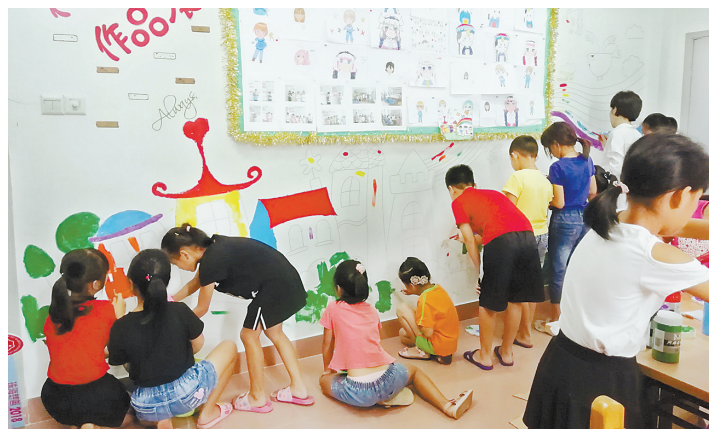
孩子们在创作墙画。

本报讯(记者康振华 通讯员易花) 日前,沙美社区妇联、沙美社区团支部联合沙美青春护航站举办“艺术创作”课,在授课老师的带领下,数十名孩子大家一起创作了一幅墙画《我们的家,我们的梦》。