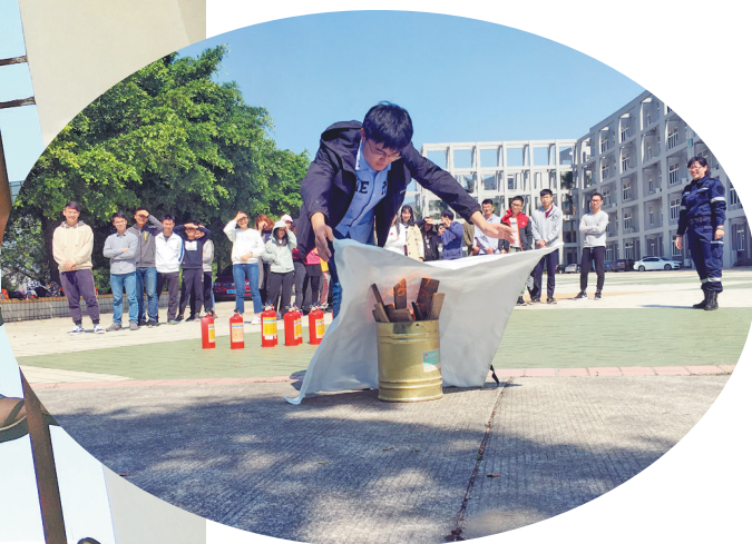
学生掌握灭火毯扑救技巧。关键要看准火头,从身体内侧往外覆盖,以免殃及自身。