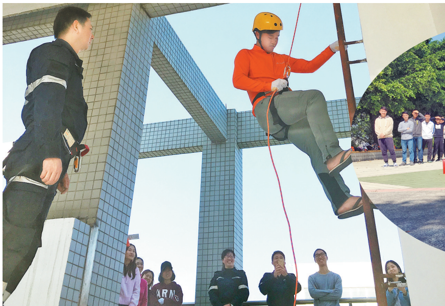
一名学生完成逃生缓降,但教官指出穿拖鞋上场有违应急规范。