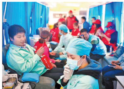
社工组织志愿者无偿献血。

本报讯(记者张帆)昨日上午,珠海市红十字会中心血站的采血车停靠在井岸镇新青盛客超市外的广场上,该采血车系心益社会工作服务中心提前预约,来到新青工业园区这个人流量的地方,组织志愿者在“雷锋月”期间积极无偿献血。