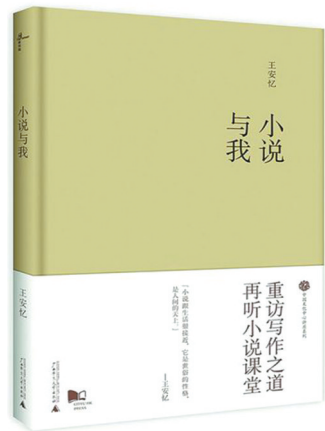
《小说与我》 王安忆/著 广西师范大学出版社