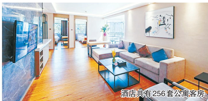
酒店共有256套公寓客房